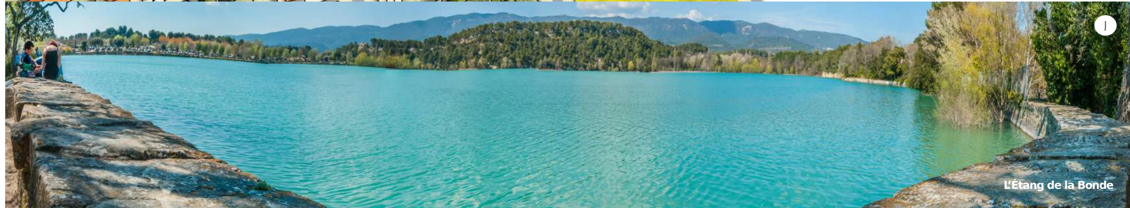
L'Étang de la Bonde

Après la Révolution, on assista au retour de quelques familles exilées à la suite du massacre des Vaudois, alors un nouveau temple est édifié en 1817 avec beaucoup de malheurs et ne tardera pas à tomber en ruine à la fin du XIX ème siècle. Sa reconstruction fut décidée au cours de l'année 1904 et il put ainsi être inauguré le 30 juillet 1905.