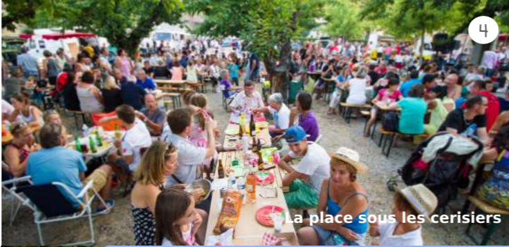
La place sous les cerisiers

Gustave Fagniez (1842-1927), écrivain et académicien, était propriétaire du château de la Bonde au bord de l'étang du même nom.