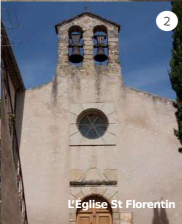
L'Eglise St Florentin