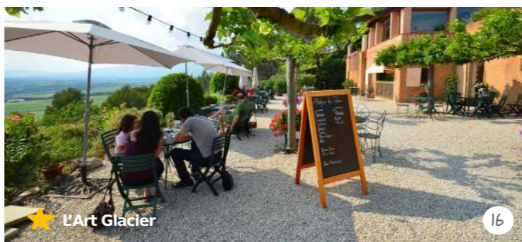
★ L'Art Glacier

L'Art Glacier est un lieu atypique et unique où plus de 60 parfums de glaces et sorbets vous sont proposés. Tous ceux-ci sont fabriqués sur place, alors lequel prendrez-vous ?